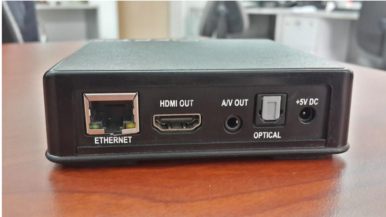
Các cổng kết nối của Bộ giải mã

Bước 4: Bấm nút Power trên remote để khởi động thiết bị.