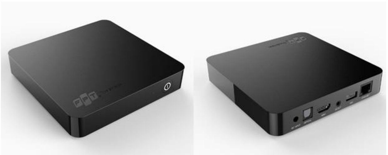
Bộ giải mã phiên bản mới.