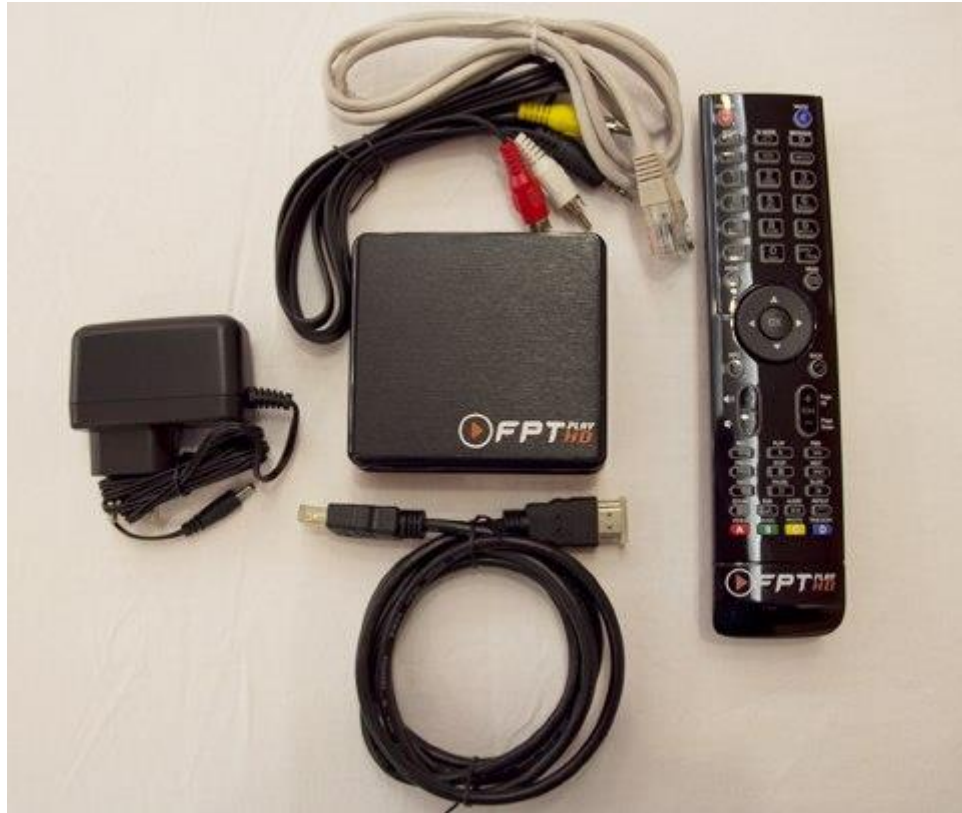
Bộ giải mã Truyền hình FPT và thiết bị đi kèm.